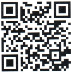
ดาวน์โหลดเอกสาร