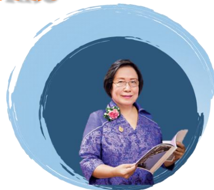
ศ.เกียรติคุณ ดร.ชุตีมา สัจจานันท์ อุปนายก สภามหาวิทยาลัย

ประการแรกต้องปรับ Mindset และพัฒนาทักษะด้านวิชาการ ทักษะ Digital Literacy ของบุคลากรให้พร้อมเผชิญกับการเปลี่ยนแปลงในยุค Disruption เพื่อพลิกโฉมการผลิตบัณฑิตและพัฒนาครูยุคใหม่ ที่มีสมรรถนะตอบโจทย์ความต้องการของตลาดแรงงานในอนาคต”