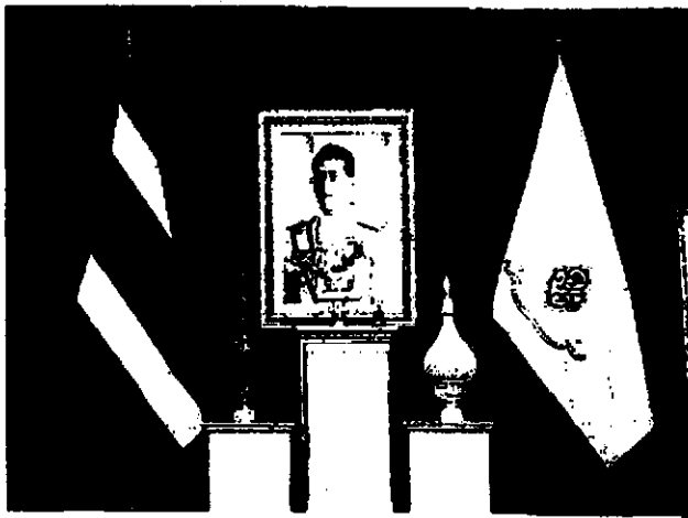
ตัวอย่างการตั้งโต๊ะหมู่ถวายราชสักการะ