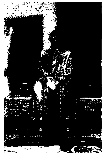
พระฉายาลักษณ์สมเด็จพระเจ้าอยู่หัวที่พระราชทานแล้ว